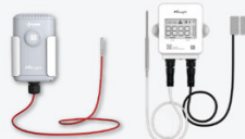
冰冻食品温度监测